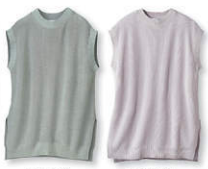
2) ミント ライトグリーン

組合員さんの声 前身ごろの縞み地のデザインもシンプルでスッキリ、いい感じです (コープらぶ・KEIKOさん)