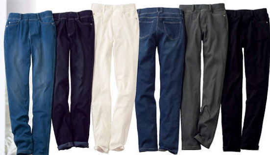
1 ウォッシュドブルー ブルー ホワイト インディゴ(バックスタイル) シャンブレー ブラック

●素材:インディゴ・ブルー・ウォッシュドブルー=綿92%・ポリウレタン8%、ホワイト・ブルー・シャンブレー=綿54%・ポリエステル38%・ポリウレタン8%(ニット、丸縮み・タテヨコのび、インディゴ・ブルー・ウォッシュドブルー=プラスティック加工) ●ポケット5個付き ●ウエスト総ゴム入り ●中国製 ●パルシステム加工のため、商品により仕上がり・色合いの出方が異なります。