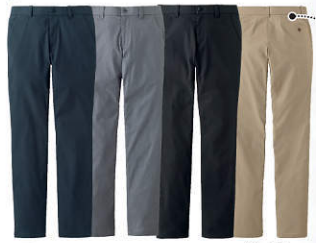
4 ネイビー グレー系 ブラック ベージュ (ハックススタイル)