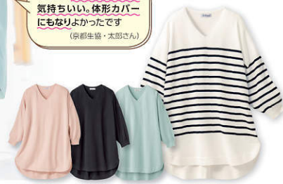
3) ピンク ベージュ ブラック ミント ボーダー

組合員さんの声 色もよく着心地もサラッと気持ちいい。体形カバーにもなりよかったです (京都生産・太郎さん)