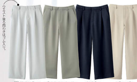
① アイスグレー グレイッシュカーキ ネイビー グレージュ