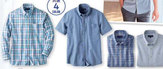
5 チェック ブルー ネイビーチェック ストライプ