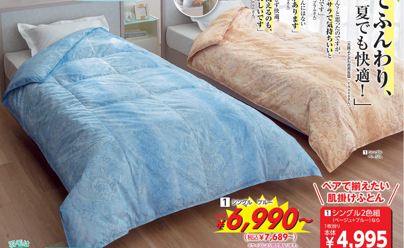
1 シングル ベージュ