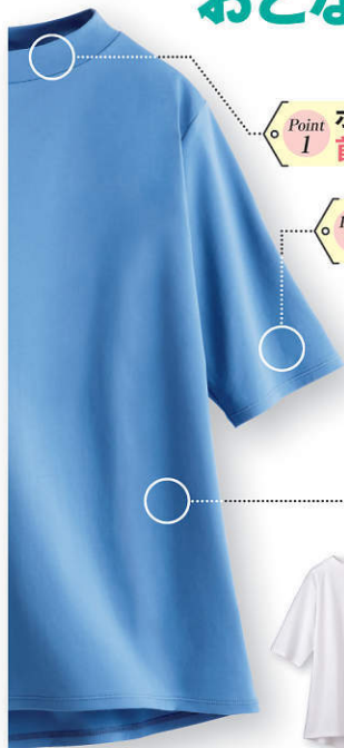
①ウォッシュブルー