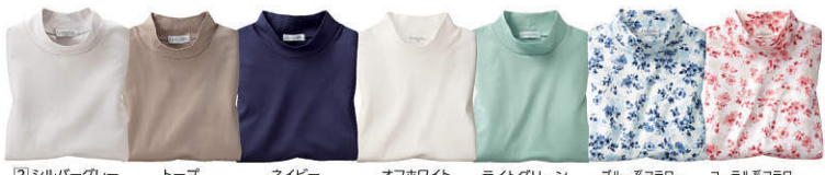
② シルバーグレー トープ ネイビー オフホワイト ライトグリーン ブルー系フลาวワー コーラル系フลาวワー

組合員さんの声 ハイネックですが、びったり過ぎないので涼しく感じます (コープ・すますまさん) 光沢も程よくあり、ちょっとしたお出掛けに活躍してくれそうです (コープあいち・マルのおかさん)