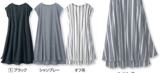
1) ブラック シャンプレー オフ系 ネイビー系